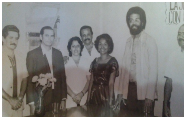
Examen para especialista, mayo de 1986

Al iniciar su actividad laboral es ubicado en el hospital “Mártires de Las Tunas”, como médico anestesista y jefe de la unidad quirúrgica. En 1978, por necesidad del organismo, pasa al policlínico comunitario docente “Gustavo Aldereguía Lima” como director del mismo, cargo que desempeña hasta 1980, año en que es promovido como vicedirector de asistencia médica en el municipio Las Tunas, hasta su liberación para realizar la especialidad de Medicina Legal en el hospital “Ernesto Guevara de La Serna”. Obtuvo el título de especialista de primer grado en Medicina Legal en mayo de 1986, siendo ubicado en este mismo hospital.