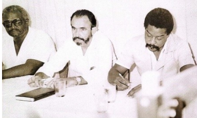
IMAGEN 3. Profesores en tribunal de examen