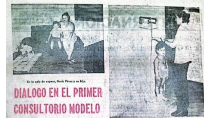
IMAGEN 4. Noticia en periódico que hace referencia al primer consultorio modelo del país (91-01), ubicado en el reparto "Aeropuerto"

El resto de la población fue cubierta por el segundo y tercer grupos de médicos de familia graduados, donde se priorizaron las áreas de mayor vulnerabilidad teniendo en cuenta los riesgos sociales, ambientales e indicadores de salud desfavorables.