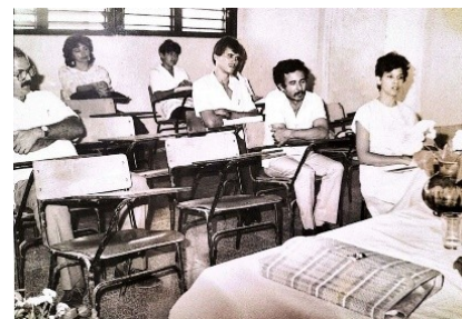
IMAGEN 2. Residentes de Medicina General Integral de Las Tunas (1985-1988) recibiendo docencia