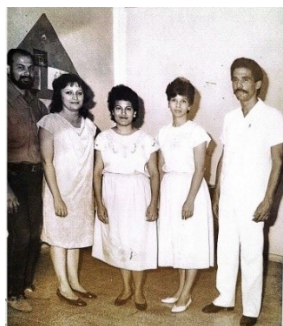
IMAGEN 1. Fundadores del programa del médico y enfermera de la familia